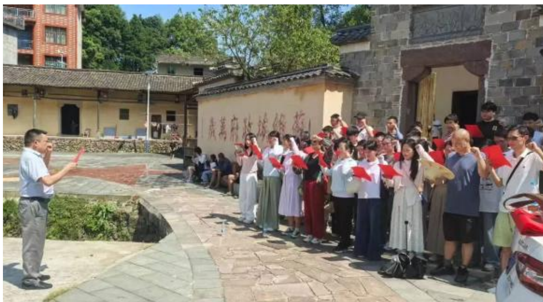
图 3-4 教师师德师风的宣誓活动

三是鼓励年轻教师绽放青春,不负韶华。为了检验和提升新入职教师的教學能力,进一步巩固教育教學基本功,展現年輕教師的才華,為他們的專業化發展搭建一個互動與溝通的平台,以促進他們更快地成長,學校舉辦了新進教師匯報課活動。