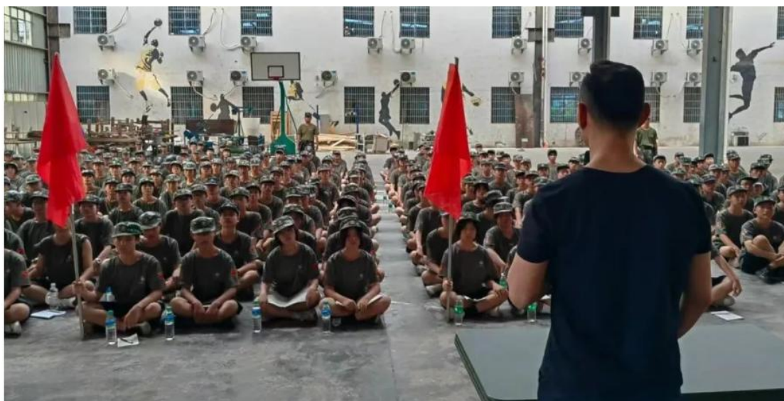
图 4-5 宣讲红色故事

在校方发展的历程中，校风的传承扮演着不可或缺的关键角色。良好的校风为教学活动注入了持续的活力，激励着教师们在教育领域深入钻研、创新教学方法、不断奋进，从而不断提升自身的教育教学能力；同时，良好的校风也是培养学生的专业素养和工匠精神的肥沃土壤，助力他们在未来的职场生涯中脱颖而出、稳健成长。