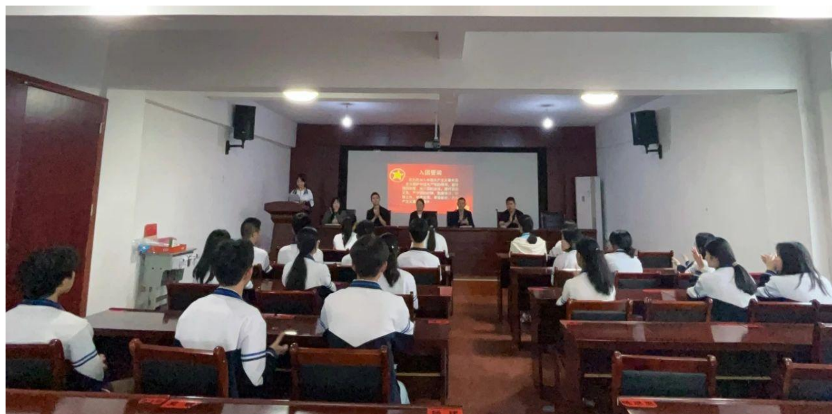
图 2-1 入团仪式

党建引领特色教育文化。学校高度重视学生思政教育，引导学生树立正确的世界观、人生观、价值观。同时，研究分析当前职业教育政策和改革发展要求，构建让学生主动发展的课堂。充分利用现代信息技术手段辅助教学，如班班通、白板等方式辅助课堂教学，提高教学容量、及时反馈评价等，从而提高课堂效率，建立适合职业教育特点的课堂教学结构模型。