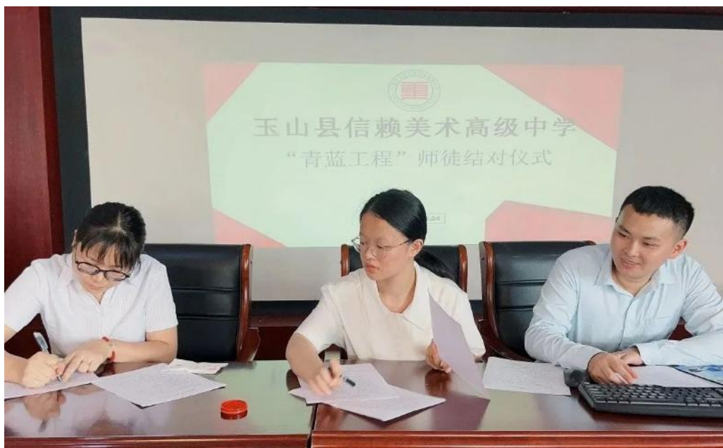
图 3-3 青蓝工程结对仪式

一是实施“党建+青蓝工程”。为加速我校青年教师的成长步伐，减少新教师的摸索时间，并充分发挥资深教师在传授知识、帮助和引导方面的作用，学校启动了青蓝结对项目。该项目充分利用学校党员骨干教师及杰出教师的模范带头作用，协助青年教师快速满足教学岗位的基本标准，实现师德修养、教学技能与教育管理能力的全面提升。通过相互学习、相互协助，共同提升教学业务水平，以实现教师团队的整体优化。