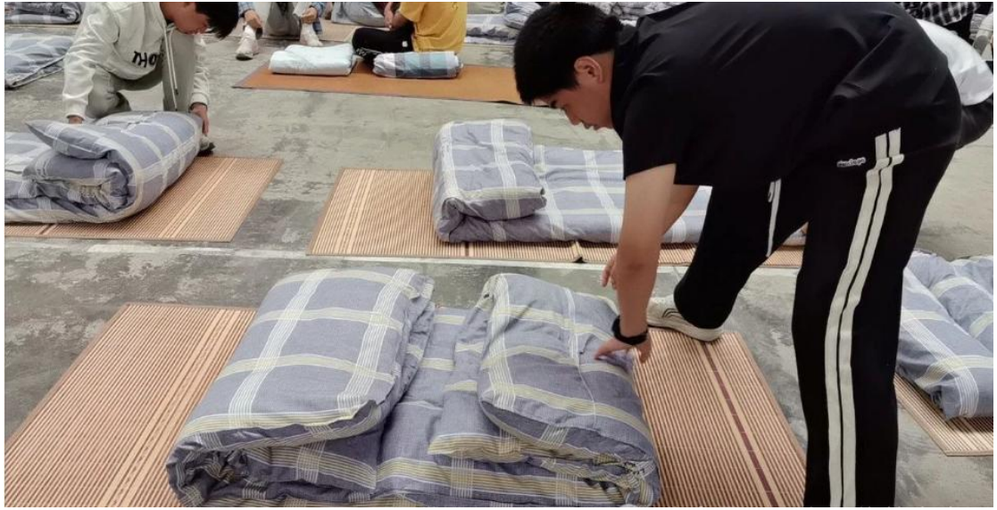
图 2-4 叠被子比赛