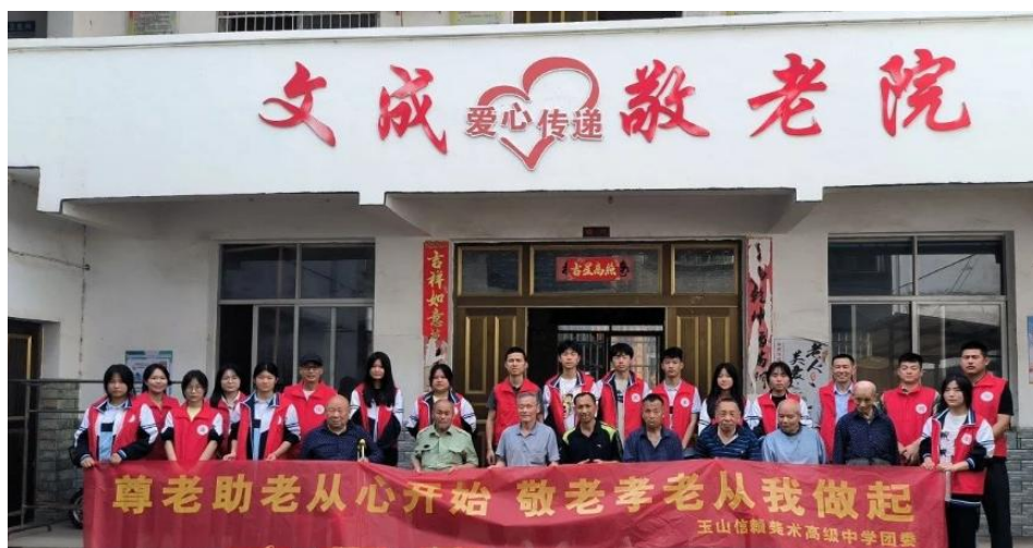
图 4-2 信赖高中党支部敬老院青春志愿行

志愿者们带着慰问品到敬老院看望慰问孤寡老人，为老人送去温暖和关怀，了解老人日常起居，详细询问老人生活和身体情况，认真聆听老人的心声。活动中，志愿者们参观了敬老院，与老人亲切地拉家常，帮助老人打扫卫生、整理房间、晾晒床单，不一会儿便和老人们熟悉起来，看到老人们洋溢着的笑容，志愿者们也由衷的高兴。