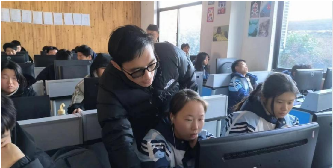
图 2-7 计算机专业

据相关调查表明，企业招聘中除软件专业外，对于计算机都要求有一定的操作的能力而熟练的操作无疑是一个极大的闪光点可以让自已从应聘者中脱颖而出，为了让学生在今后具有更广阔的发展前途，需要让学生掌握计算机办公应用能力。因此，我校另一专业为计算机，促进学生的学习与就业。