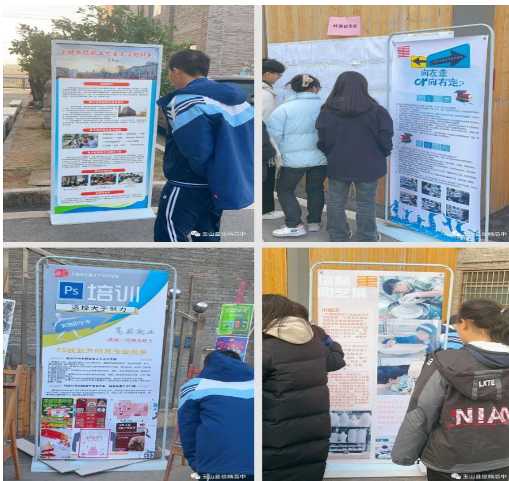
图 4-1 举办职业教育活动周

注重培养学生的动手能力和创新思维。通过开展劳动教育、科技制作、手工艺术等课程和活动，让学生从小接触各种工具和材料，学会基本的操作技能，激发他们对技能学习的兴趣和热爱。同时，教育学生树立正确的劳动观念，尊重劳动成果，培养他们的责任感和敬业精神。