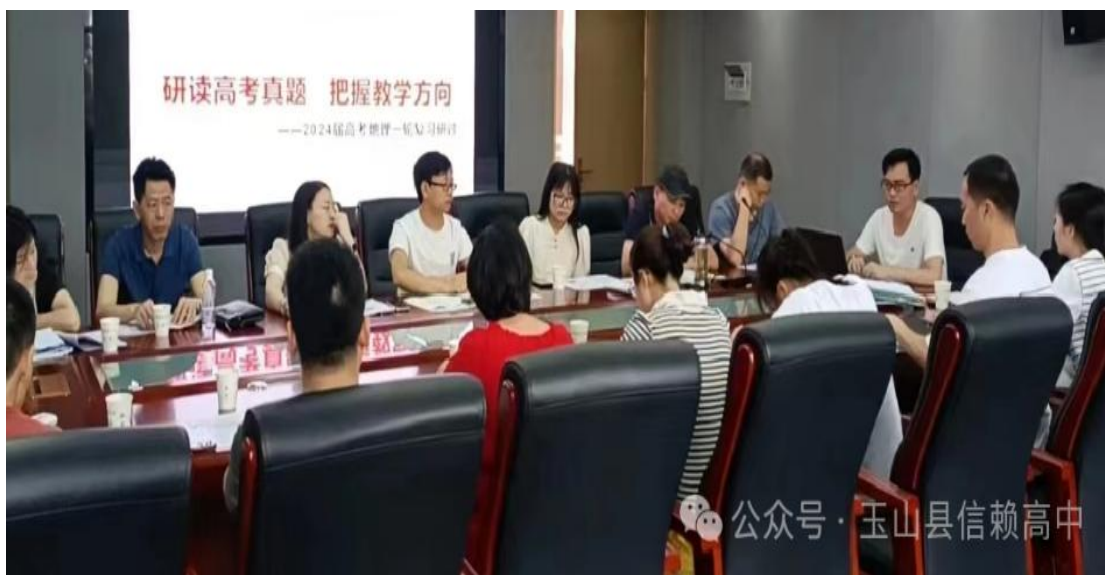
图 3-5 赴玉山一中参加研究新高考真题会议

为适应学校教学工作需要，提高教育教学质量，保证教学活动的正常进行，进一步加快学校教材管理工作的科学化、制度化、规范化建设，为落实国家和省级有关教材建设工作要求的实施方案文件精神，学校成立了教材工作领导机构，负责全面审核工作，成立教材选用委员会，负责前期教材选用。明确具体职责，先后出台了教材选购和预订办法、校本教材管理办法、教材发放办法、教材库管理制度，各项工作有序开展。