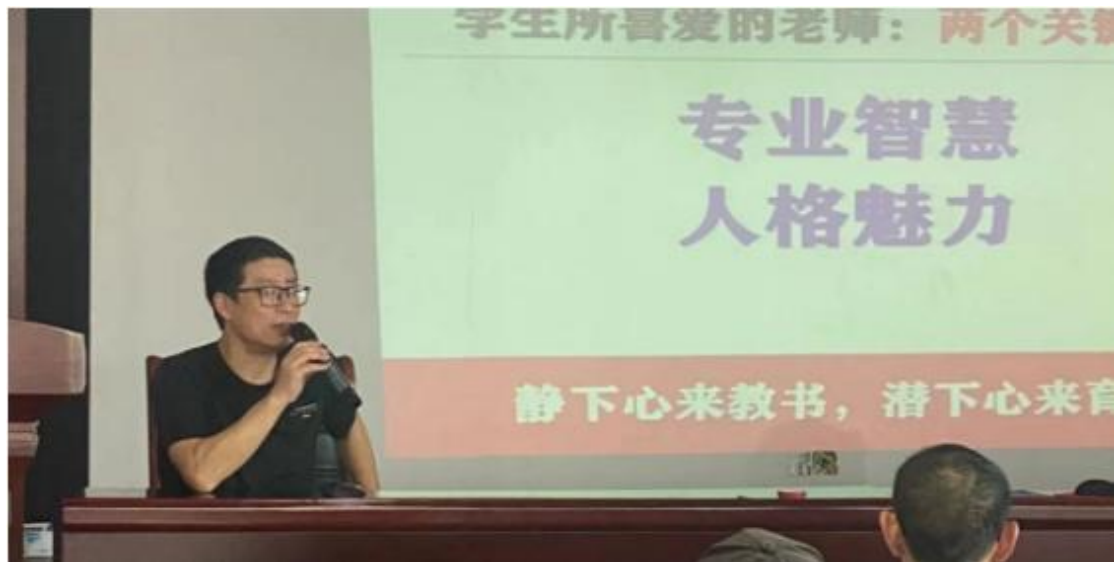
图 3-1 聘请专家研究专业建设

立足社会需求，优化专业设置。依据区域经济社会发展状况，对专业设置进行动态调整。学校以服务当地经济社会发展为优先方向，深化“校企协同育人、教产相互促进”运行机制，在对社会人才需求调研和开展校企合作育人的基础上，学校不断优化园林绿化、建筑装饰、音乐专业等建设，拓宽办学渠道。