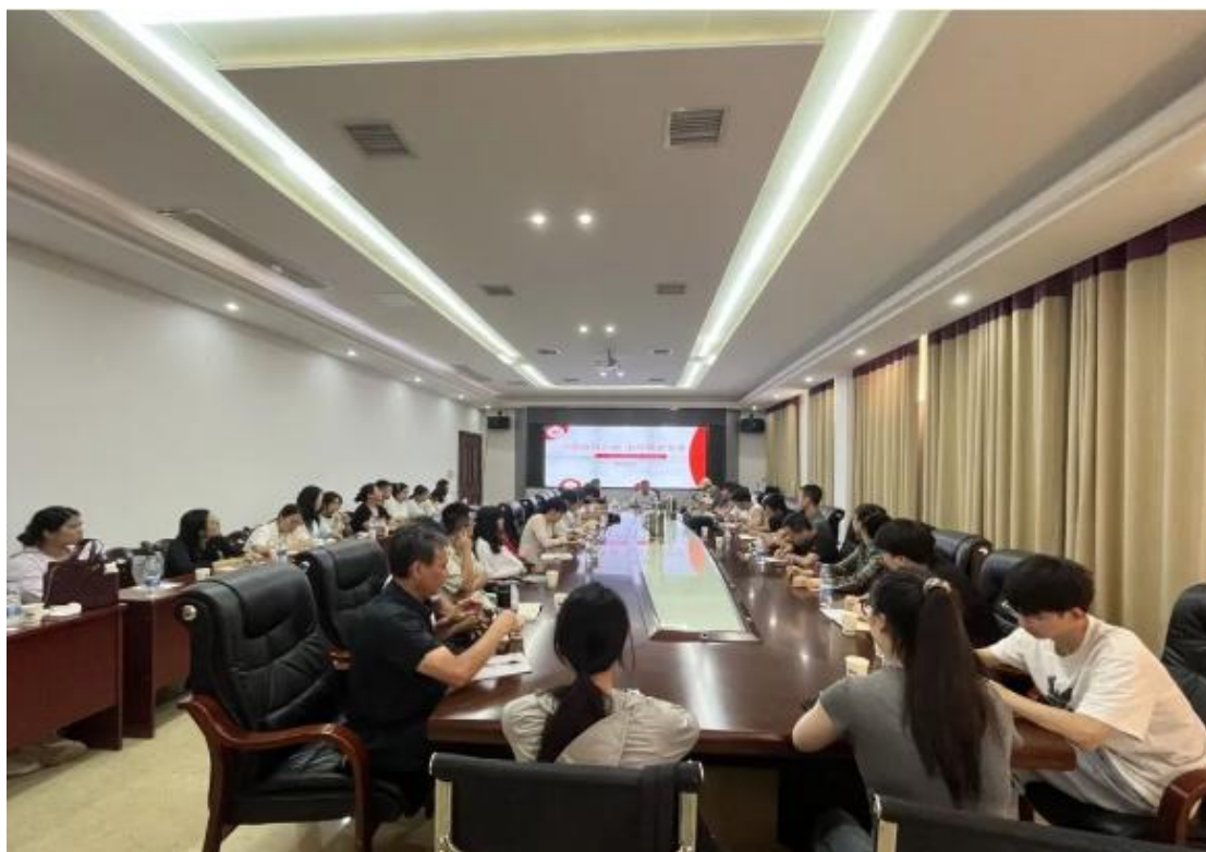
图 3-2 教师培训 凝聚师情