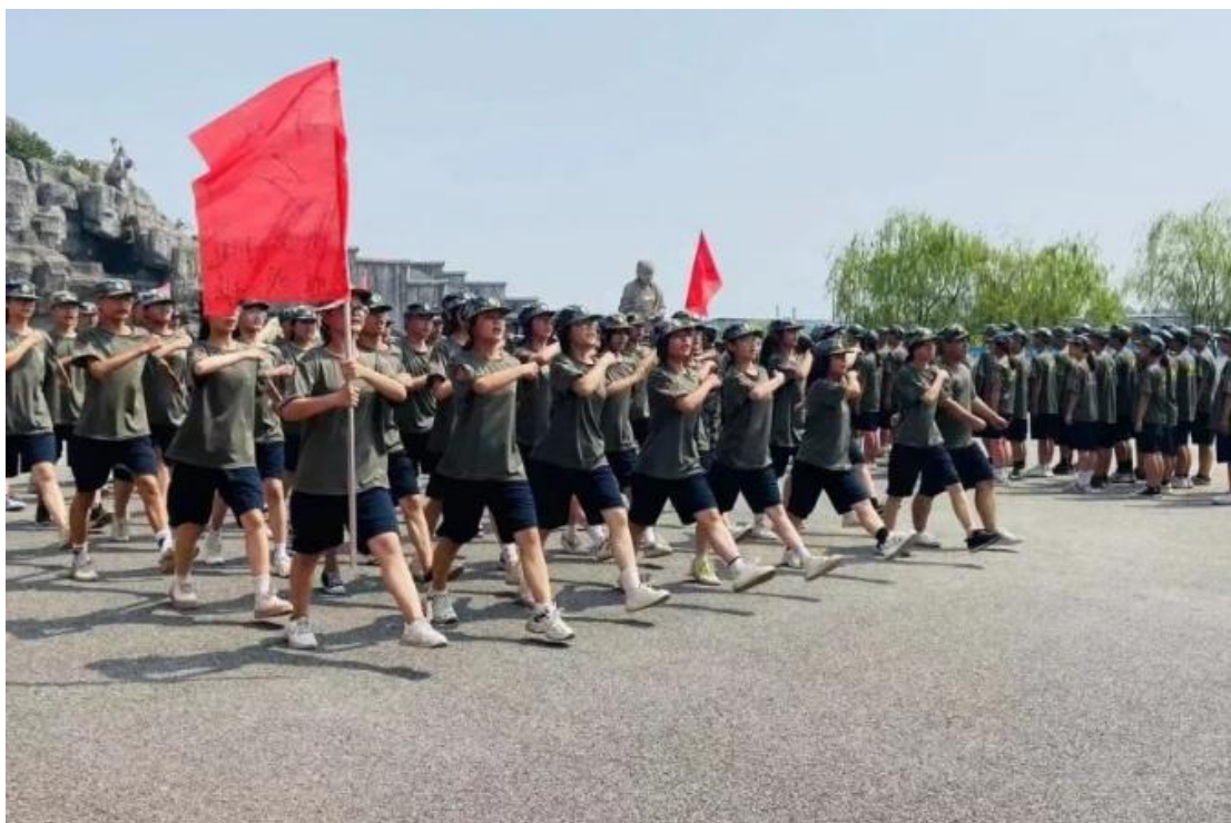
图 4-6 强基训练