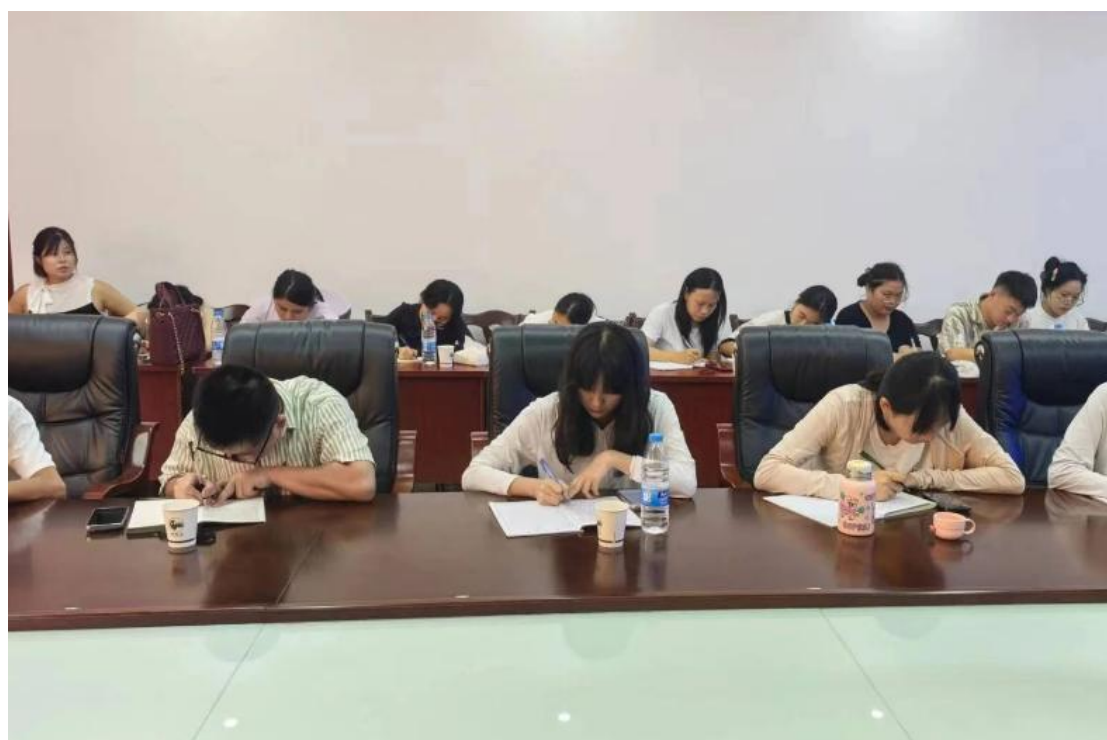
图 3-6 组织研究校本教研

(3) 突出重点带动全体 学校制定了专业带头人、骨干教师培养计划以及骨干教师、青年教师培训制度，积极组织教师参加各级培训，培训重点面向专业带头人、骨干教师和优秀青年教师。