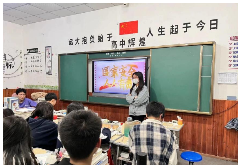
图 2-10 国家安全主题班会

将德育教育纳入专业人才培养方案和课程体系建设中。开展德育创新课堂、推动思政课教学内容改革、教学手段改革、教师能力提升和信息化应用能力提升，继而提高思政课的课堂效率。以思政课程为主阵地，德育活动为辅阵地，共同发挥思政课堂的综合素质教育作用。思政课堂教学形式多样，内容丰富多彩，充分结合我校学生特点，思政课教学实施有声有色。积极践行社会主义核心价值观，努力提高思政课教学的针对性、时效性和时代感，使社会主义核心价值观生动具体地融入到学生学习成长的全过程。