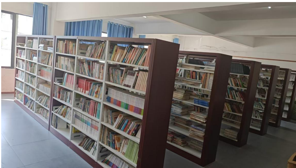
图 1-1 学校图书馆

学校目前拥有价值 300 万元的教学仪器设备，馆藏纸质图书达到 2 万册，电子图书 1.5 万册。校园内设施齐全，不仅包括用于学习的多媒体教室、实训基地、实验室、美术馆、图书馆、会议室，还设有用于生活的学生公寓、室内体育馆、室外运动场、室外篮球场。