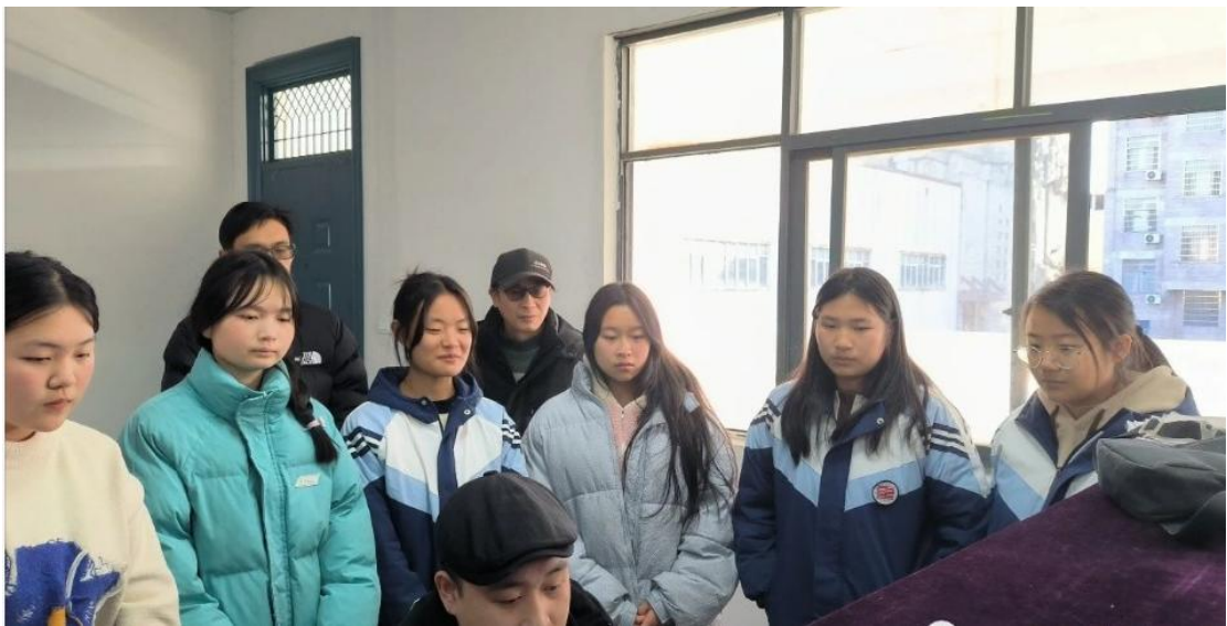
图 2-6 幼儿保育专业

幼儿保育专业是中华人民共和国教育部研究确定《中等职业学校专业目录》增补的新专业，属于教育类专业。我校的本专业坚持立德树人，德技并修，主要面向托幼儿园所、社会福利及其他保育机构等，从事儿童基本生活照料、保健、自理能力培养和辅助教育工作。培养具有良好的职业道德，现代科学文化知识，具备扎实的专业基础知识、基础理论和基本技能，以及组织管理和教学能力，具有综合职业能力和创新精神，从事幼儿园教育、保育员等工作的，德、智、体、美、劳全面发展的新型幼儿教育教师和高素质的劳动者。