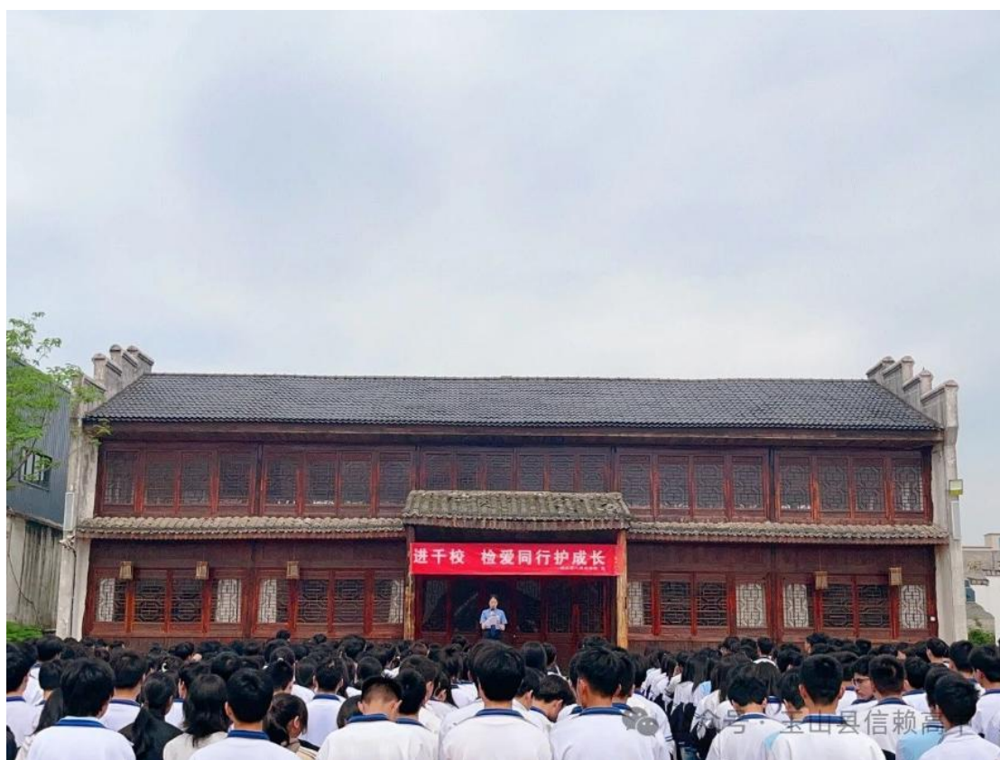
图 2-3 国旗下演讲

师生们每月围绕当月德育主题共同参与国旗下演讲，这不仅是对全体师生进行爱国主义教育的重要方式，也是展示师生精神风貌的平台。各班级围绕主题设计、排版并完成班刊，这一过程不仅营造了良好的德育氛围，也起到了积极的宣传效果。此外，每月的主题大活动，例如“讲文明树新风”叠被子比赛，有效引导全校师生养成良好的文明卫生习惯，进一步优化了学校的育人环境，促进了和谐文明校园的建设。通过这些精心设计的活动，我校确保德育工作落到实处，为学生的全面发展奠定了坚实基础。