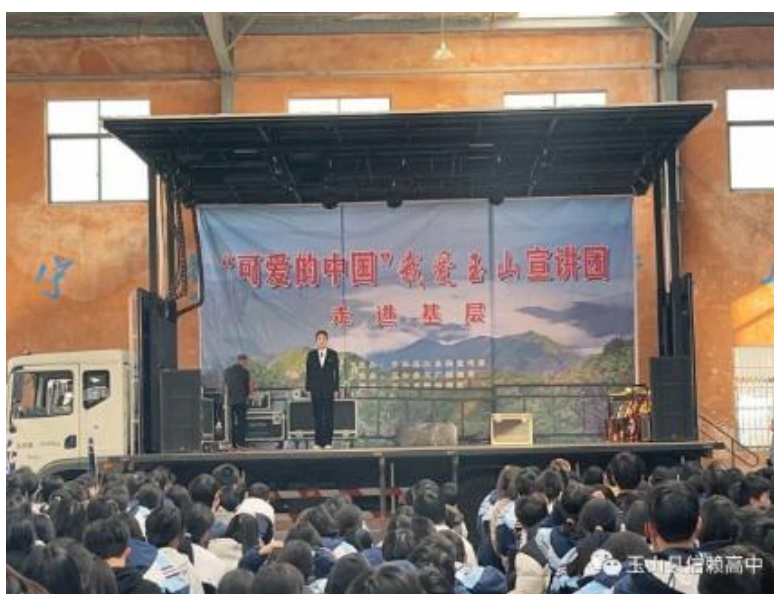
图 4-4 方志敏红色教育活动

感悟方志敏的崇高信仰，筑牢信仰之基、补足精神之钙、把稳思想之舵，敢于担当，勇于挑战。九万里风鹏正举，新征程华章续篇。方志敏心中的“可爱的中国”，正处在蓬勃发展的新时代！