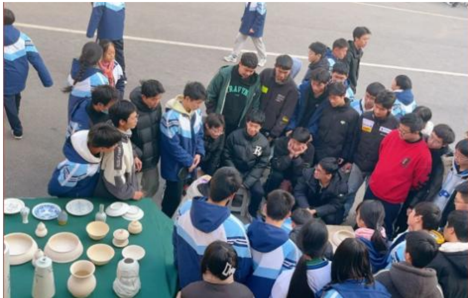
图 2-5 工艺美术专业

我校的工艺美术专业里，主要有绘画、雕塑，以及陶瓷三大领域。传统工艺美术尽管经历了漫长的历史洗涤，已经失去了原来主流地位，但其在现代仍然扮演着不可忽视的角色，其蕴含的历史文化精髓依然是完善我国现代设计的重要源泉。工艺美术作为我校的特色专业，不仅为学生提供了一个学习相应技能的平台，同时也提高了学生的审美。