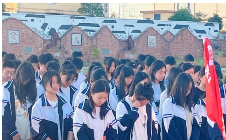
图 4-3 九一八默哀活动

到东北三省父老乡亲在侵略者铁蹄下的呻吟与挣扎。那段历史，是苦难与抗争的交织，是屈辱与奋起的并存。今天，我们在这里，不仅是为了缅怀先烈，更是为了铭记历史，警醒未来。