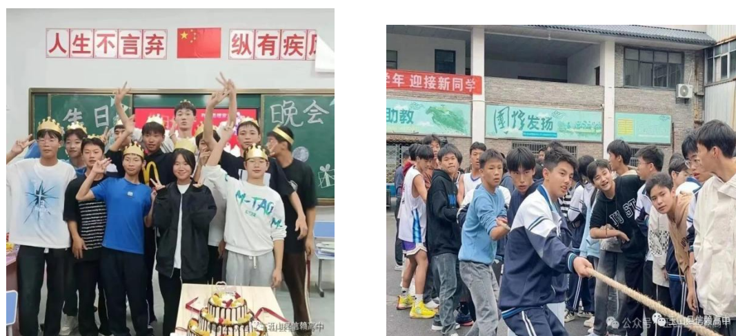
图 2-8 校园文化

学校位于玉山县城西经济开发区，交通便利，3 路公交车和 320 国道直达信赖工艺美术学校。校园有清湖绿柳、喷泉假山，更有遍布 校园的艺术雕塑，整个校园散发着浓浓的文化艺术气息。学校硬件设 施全县一流：有高标准教学楼、综合实验楼，有高配置的电脑房，一 流的音乐室、琴房、舞蹈房，室内灯光体育馆、男女生宿舍楼、食堂、 图书馆、标准田径场等一应俱全。所有教室均配备了教学一体机、中 央空调