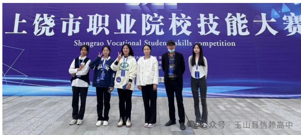
图 2-9 参加职业技能大赛

2024 年毕业生为 184 人，毕业生就业率为 85%，对口就业率为 80%以上，初次起薪在 4000 元以上，131 人升入高等院校。